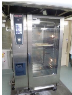
【スチームコンベクションオーブン】